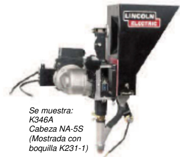
Se muestra: K346A Cabeza NA-5S (Mostrada con boquilla K231-1)