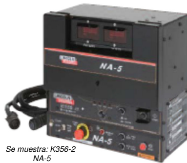
Se muestra: K356-2 NA-5